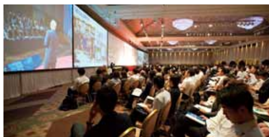
経営研究会全国大会の様子

「より良い未来に向けた経営戦略」「経営トップとしての経営観の醸成」「師と友づくり」の場として、企業経営の将来のあり方を伝える場としています。当社コンサルタントのみならず、時代に即した外部の経営者や業種・業界に精通する講師による講演を実施しています。また、本イベントでは講座形式の講演にとどまらず、当社グループのCSR活動のひとつである、「グレートカンパニアワード」の開催や、地域の優良企業と取引をしているパートナー企業と参加者とのマッチングの場とする「ビジネスパートナーフェア」も同時に開催しています。全国の中小企業経営者に有効にご活用していただくイベントとして今後もさらなる発展を遂げていきます。